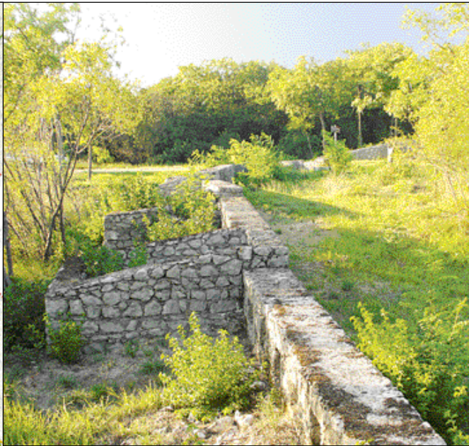
Un estratto dalla tavola del Piano di azione locale del Carso goriziano e uno scorcio del percorso della Trincea delle Frasche a Sagrado (Gorizia)

versi enti responsabili della pianificazione territoriale hanno iniziato a operare in sinergia attraverso azioni concrete in situ . Trincee, castellieri, monumenti, cippi, doline, gallerie, strutture museali e ricettive non saranno più frammenti dispersi e negletti, bensì tracce colle-